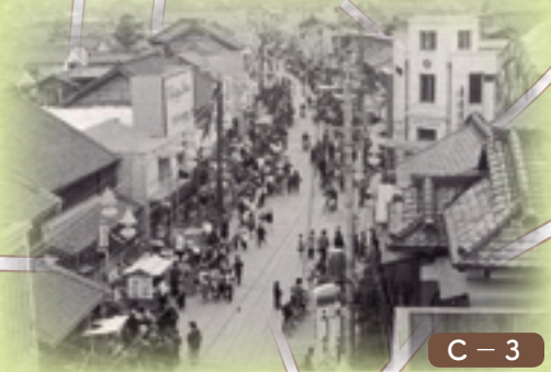
ひな市のにぎわい(昭和39年)